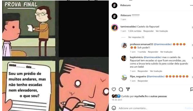
Imagem 4 - Postagem da página do Instagram - IF Obscuro