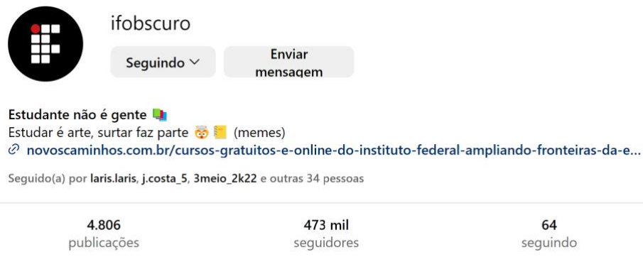
Imagem 1 - Abertura da página do IF Obscuro