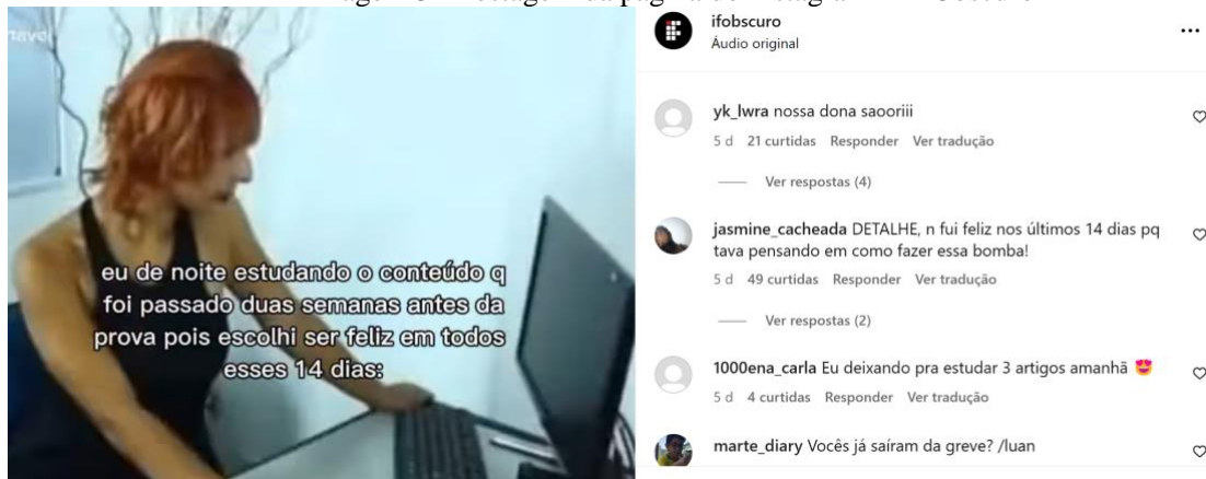
Imagem 3 - Postagem da página do Instagram - IF Obscuro