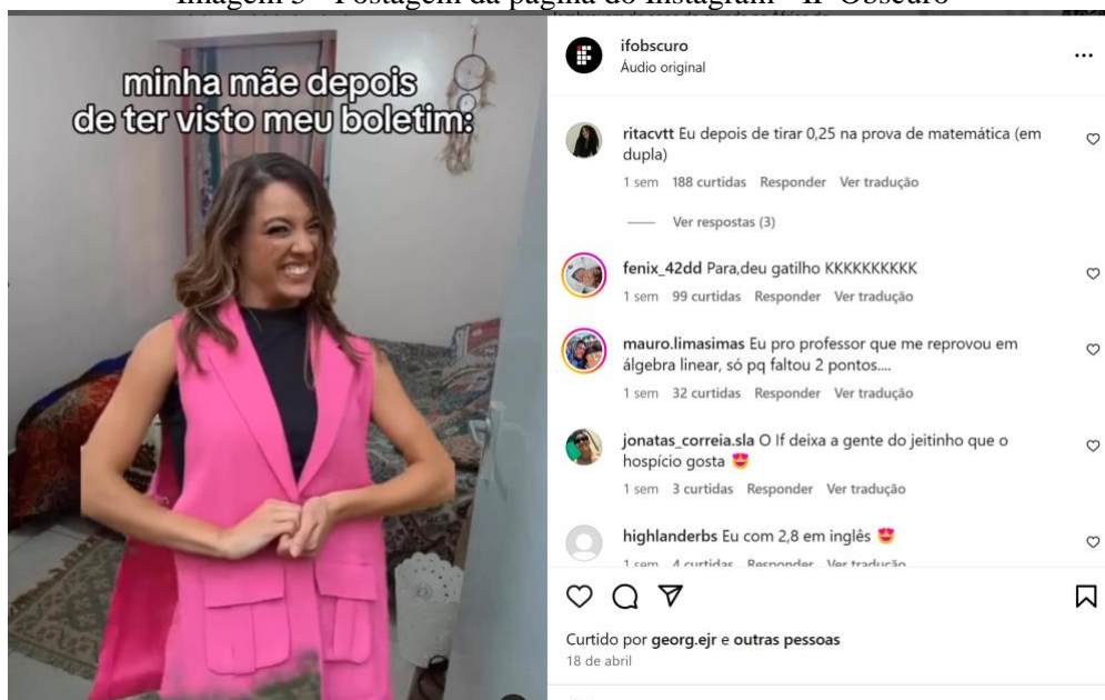
Imagem 5 - Postagem da página do Instagram - IF Obscuro