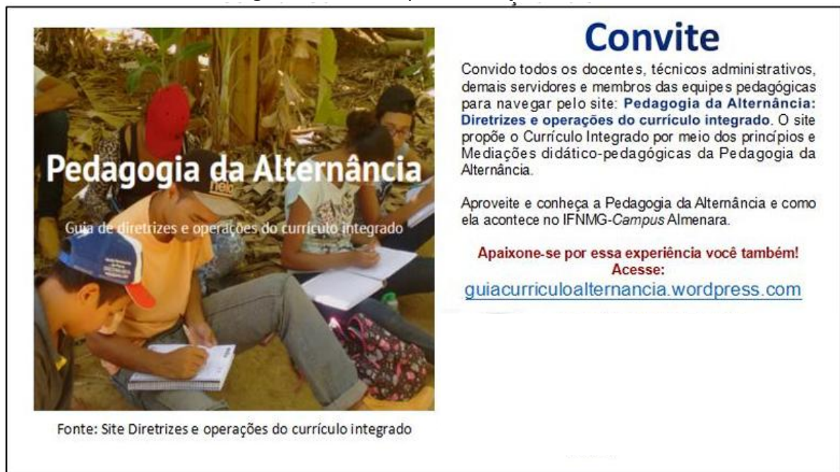
Figura 2 – Convite para avaliação do site.