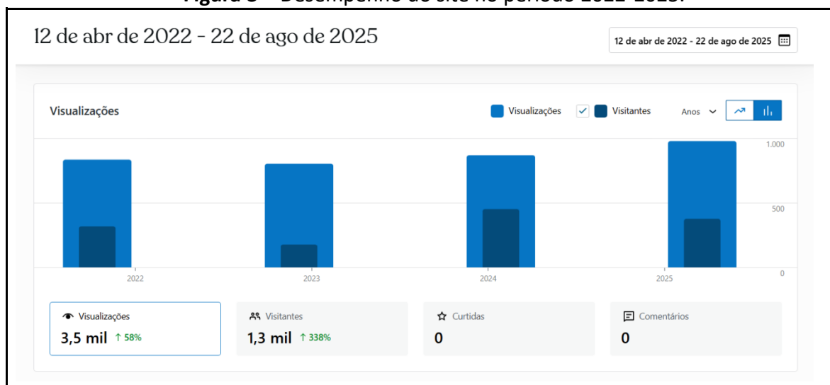
Figura 3 – Desempenho do site no período 2022-2025.

Fonte: https://guiacurriculoalternancia.wordpress.com/ .