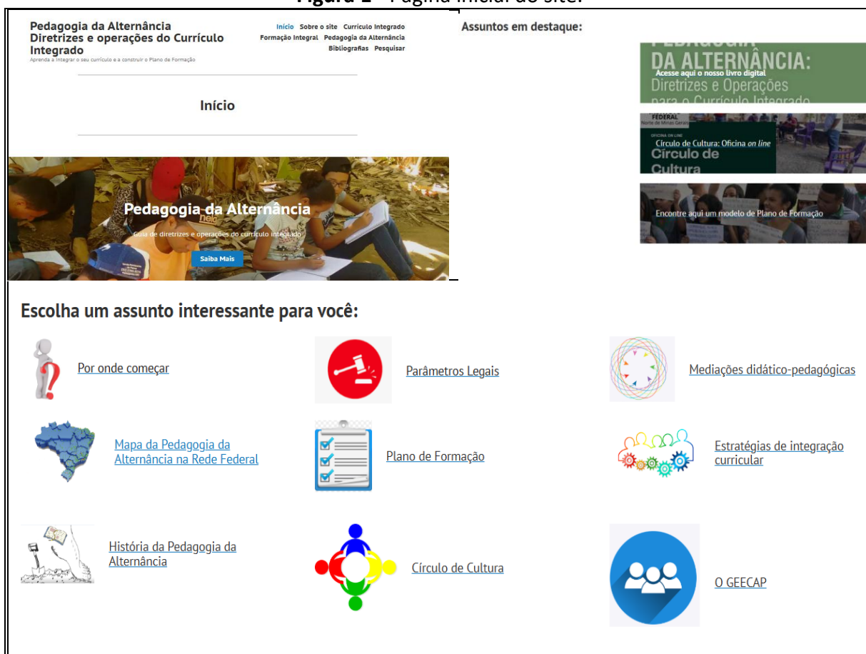
Figura 1 - Página inicial do site.

Na primeira parte do guia, no menu superior , são abordados referenciais teóricos dos assuntos principais do site tais como os conceitos de Pedagogia da Alternância, de Formação Integral e de Currículo Integrado. No menu superior, também é possível acessar a bibliografia utilizada para sua construção. Em seguida, há uma lista de assuntos disponibilizadas em destaque , a fim de atender o pesquisador que navega nas páginas do site para que este possa encontrar informações de maneira rápida e objetiva.