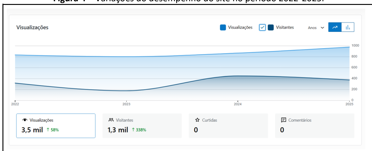
Figura 4 – Variações do desempenho do site no período 2022-2025.

Fonte: https://guiacurriculoalternancia.wordpress.com/